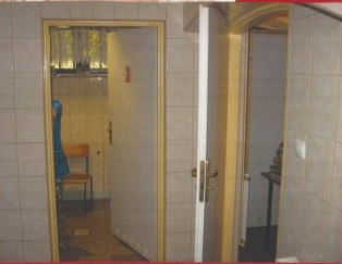
TO MAŁA BYĆ KAZIMIEŻ I LAZARENKA, ABY MOGŁA DOKONYWAĆ SIĘ WYBRANA AKTYWNOŚĆ PODWÓJNYCH STANOWISK