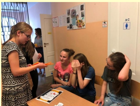
PROJEKT RÓŻY - KONKURS Z LEKTUR