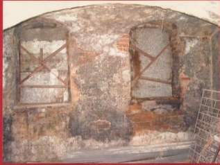
ZBITE TYNKI W CELU OSUSZANIA ŚCIAN PIWNICZYCH I OTWORY OKIENNE ZABITE BLACHĄ