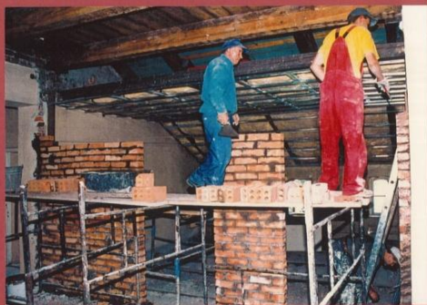
BUDOWA NOWYCH LAZIENEK NA PIERWSZYM PIĘTRZE