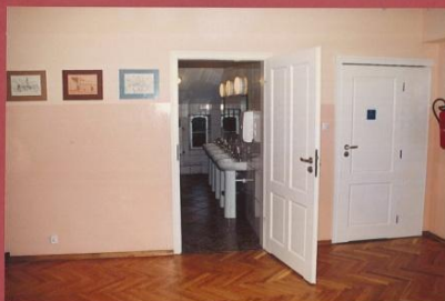
TOALETY DLA DZIEWCZĄT I DLA NIEPEŁNOSPRAWNYCH