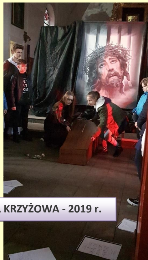
DROGA KRZYŻOWA - 2019 r.