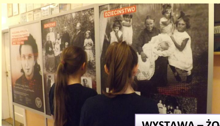
WYSTAWA – ŻOŁNIERZE WYKLĘCI – 2017r.