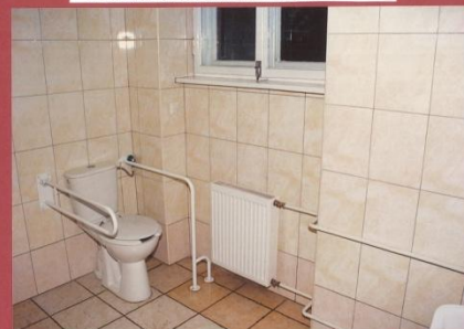
UBIKACJA DLA NIEPEŁNOSPRAWNYCH NA PARTERZE