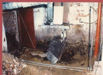
STARA KOTŁOWNIA I WEJŚCIE DO WĘZIA CIEPŁOWNICZEGO