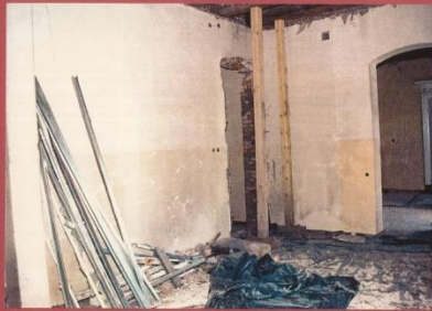
ZAMONTOWANIE STAREGO PRZEŚCIA I WYKŁADKĘ NOWYCH DRZWI TAK, ABY SAŁA NIE BYŁ PRZECIAGANE