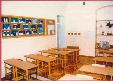
KLASA NAUCZANIA ZINTEGROWANEGO