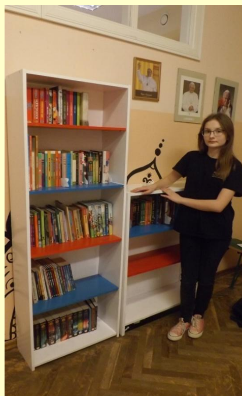
PROJEKT OLIIII - PODRĘCZNA BIBLIOTECZKA NA KORYTARZU SZKOLNYM