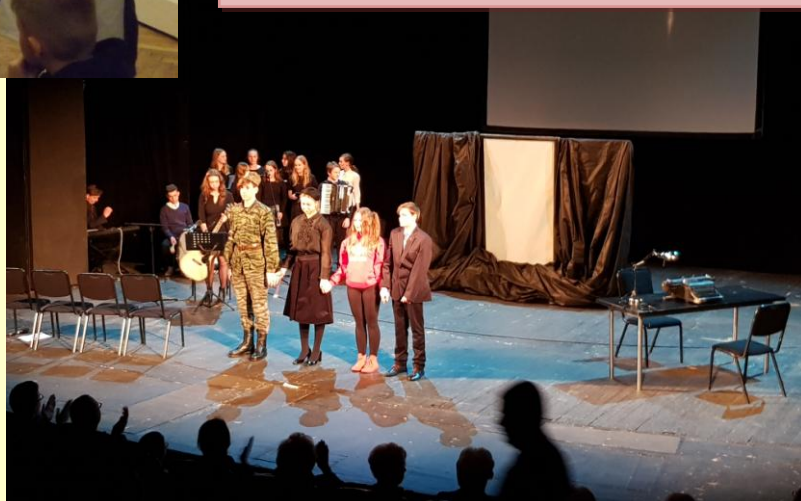
„Historie Bohaterów Niezłomnych” na scenie TEATRU WYBRZEŻE – 2018r.