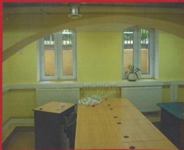
PRZYGOTOWANIE BIBLIOTEKI MULTIMEDIALNEJ