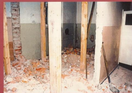
WYBURZENIE ŚCIANEK ORAZ ZBIECIE KAFELI W STARYCH LAZIENKACH