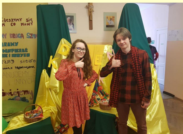
PROJEKT JAKUBA-DZIEŃ KOLORÓW