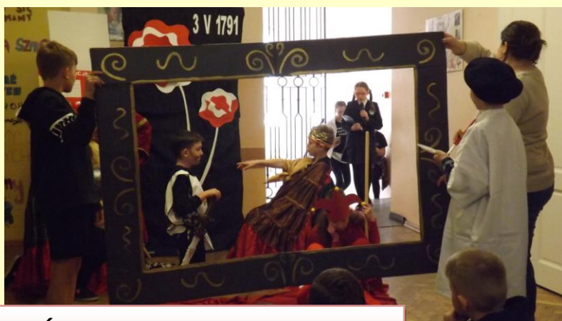
DZIEŃ KONSTYTUCJI 3 MAJA 2018r.