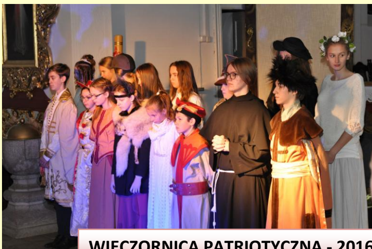
WIECZORNICA PATRIOTYCZNA - 2016 r.